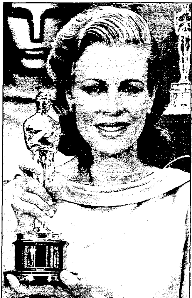
كيم باسينجر، جائزة أفضل ممثلة مساعدة